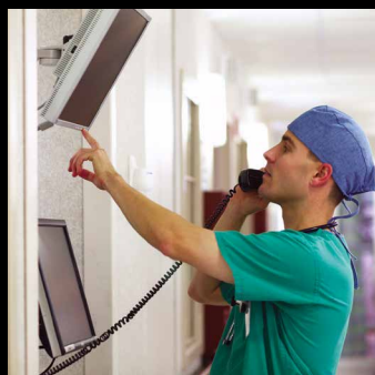
Comunicazione visiva e orientamento