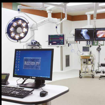
Commutazione ed estensione del segnale